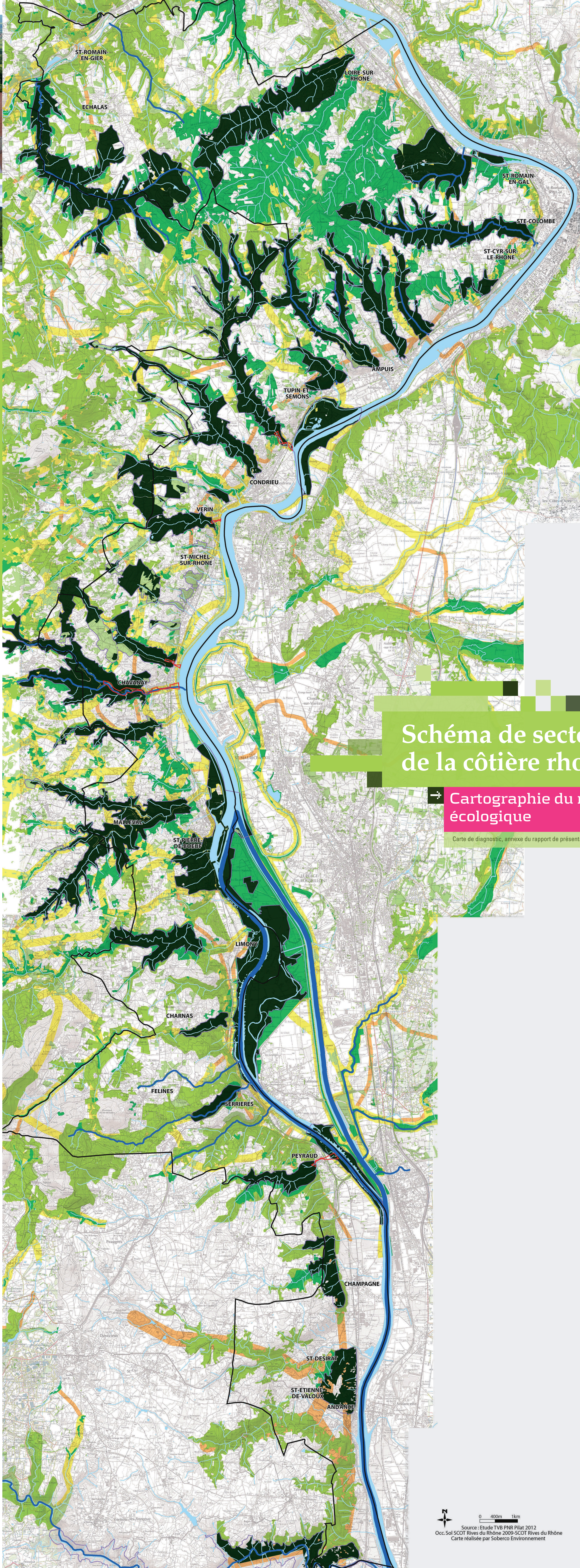
Schéma de secteur de la côtère rhodanienne