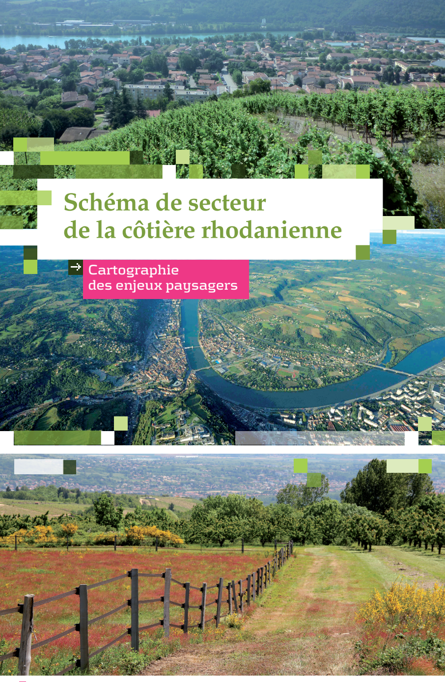
Schéma de secteur de la côtière rhodanienne