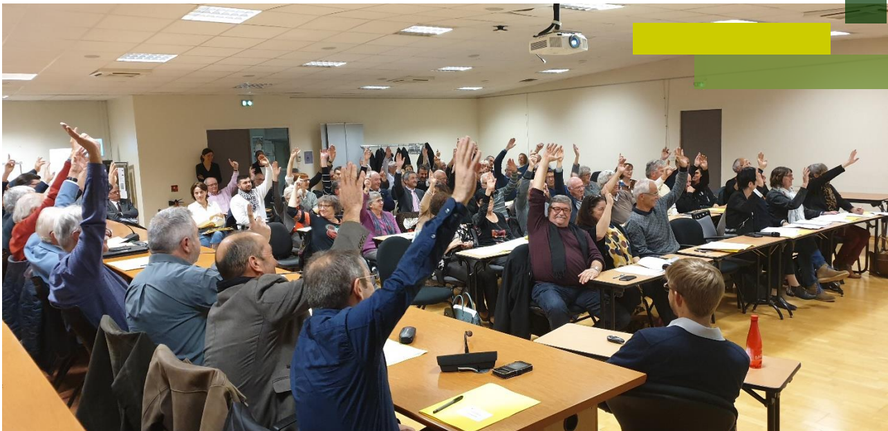
Approbation du Scot le 28 novembre