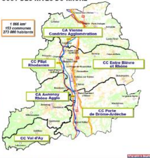
Le territoire du Scot des Rives du Rhône à la superficie d'un département.